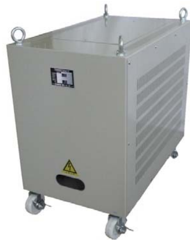
3WTC-10K: キャスターは特別注文