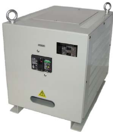
3WTC-5K: ブレーカーは特別注文