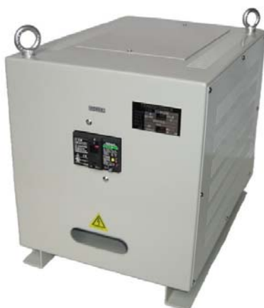
WTC-5KH: プレーカーは特別注文